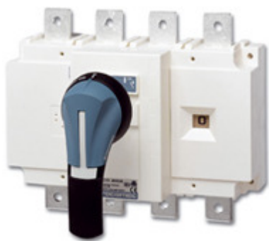
Opciones de conexión